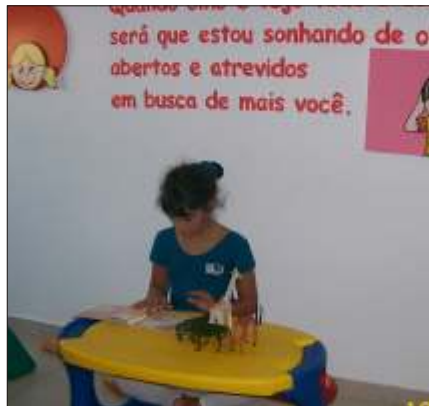
Na brinquedoteca da Clínica, agora os brinquedos se fazem acompanhar dos livros

instituições que já disponham de algum tipo de instalação que possa ser aproveitada, como uma sala de espera, uma brinquedoteca, ou algo semelhante. A Biblioteca fornece o acervo inicial de livros - um kit de aproximadamente 20 livros - que ficam a disposição dos leitores mirins que podem usa-los enquanto estiverem nas dependências do estabelecimento. Inicialmente estão sendo contatados 12 locais em diferentes bairros de Maceió atendendo a critérios de instalações, frequência de público e localização. Um desses estabelecimentos é a