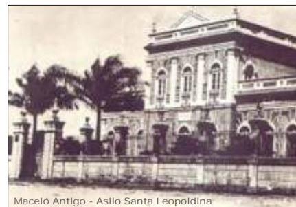
Maceió Antigo - Asilo Santa Leopoldina